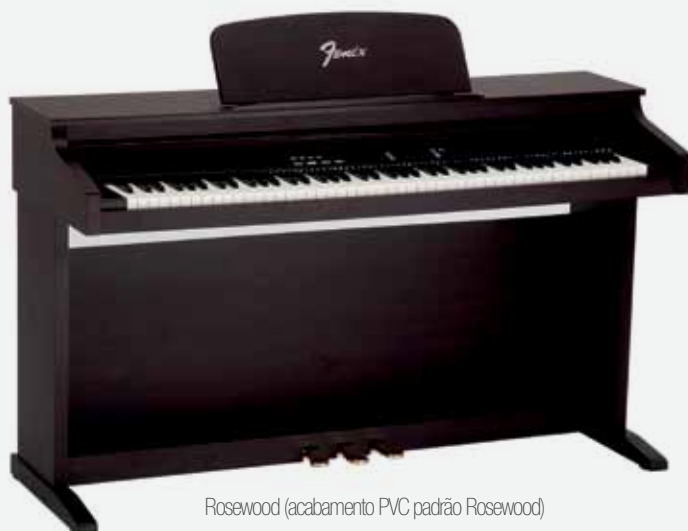
Rosewood (acabamento PVC padrão Rosewood)