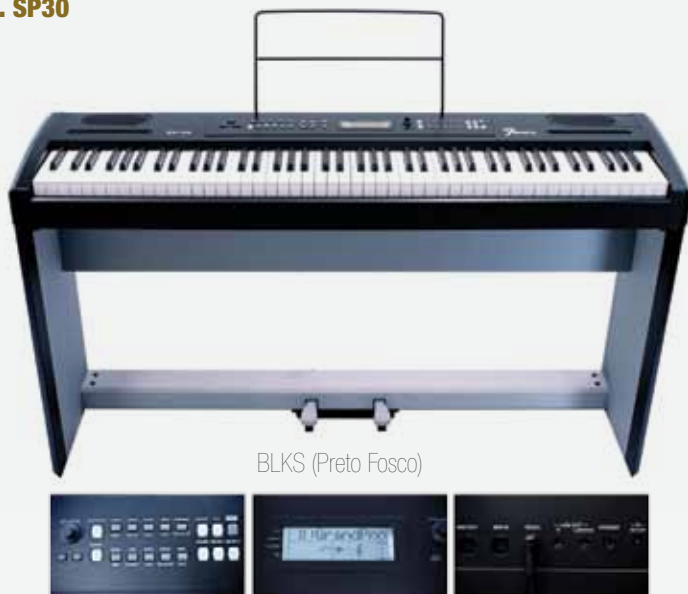
BLKS (Preto Fosco)