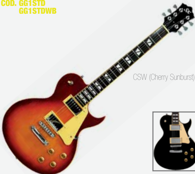
CSW (Cherry Sunburst)