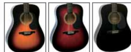
VS (Vintage Sunburst)