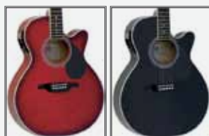
TWR (Transparent Wine Red)