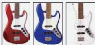
CAR (Candy Apple Red) EB (Electric Blue) WT (Branco)