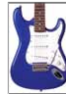
EB (Electric Blue)