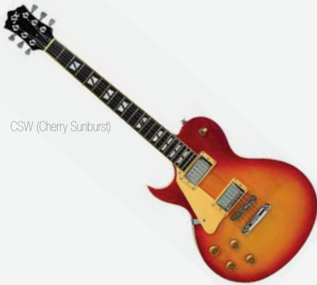
CSW (Cherry Sunburst)