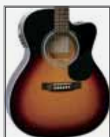
VS (Vintage Sunburst)