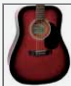
RDS (Red Sunburst)