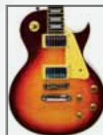
CS (Cherry Sunburst)