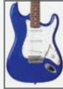
EB (Electric Blue)