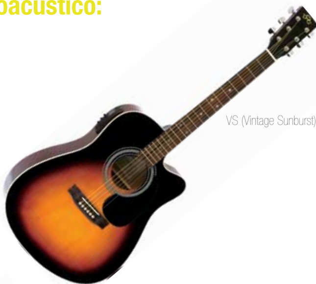
VS (Vintage Sunburst)