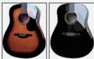
VS (Vintage Sunburst)