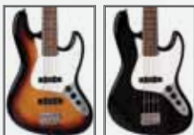
3TS (Sunburst) BK (Black)