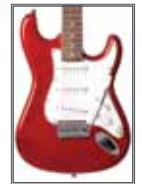
CAR (Candy Apple Red)