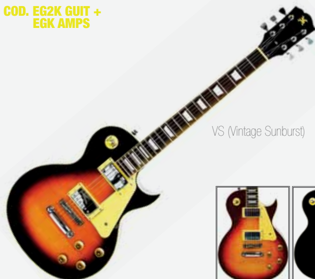
VS (Vintage Sunburst)