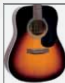
VS (Vintage Sunburst)