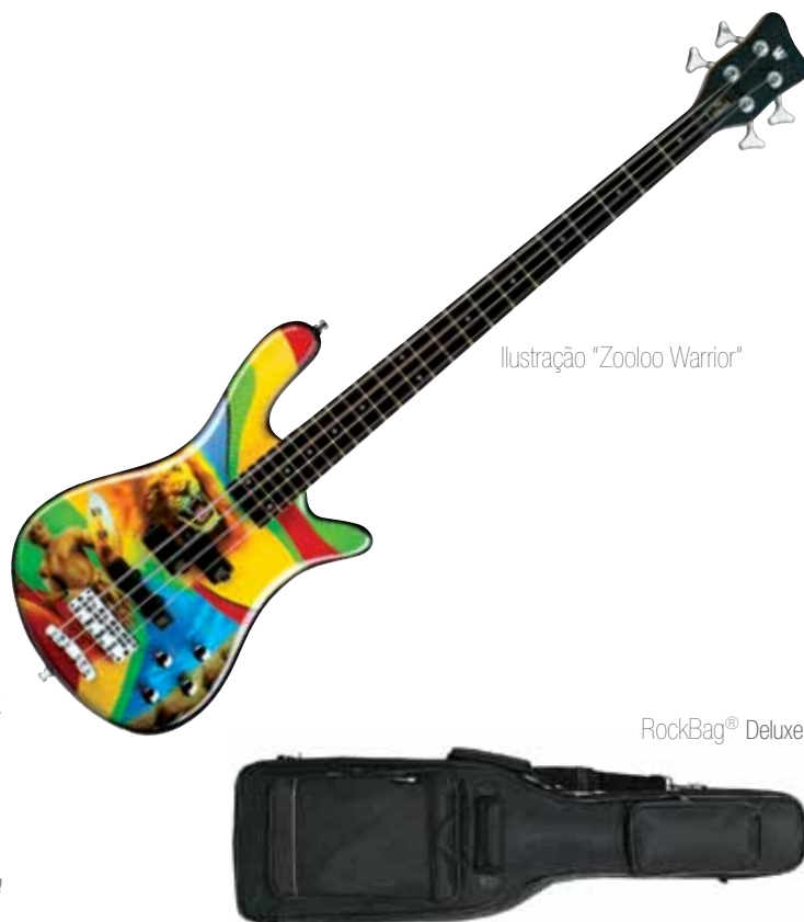
Ilustração "Zooloo Warrior"

* Puxando o botão de volume, deixa o pré-amp sem efeito, o que desativa os controles da tonalidade.