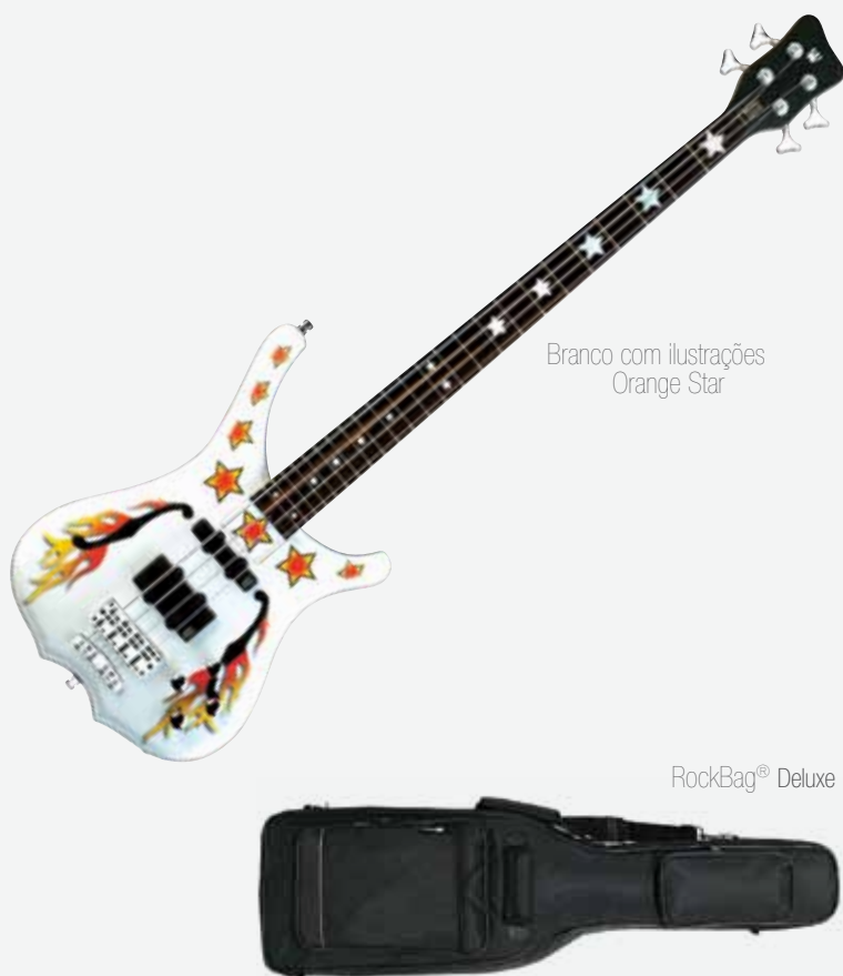
Branco com ilustrações Orange Star

** Puxando o botão de Treble, permite a divisão do captador.