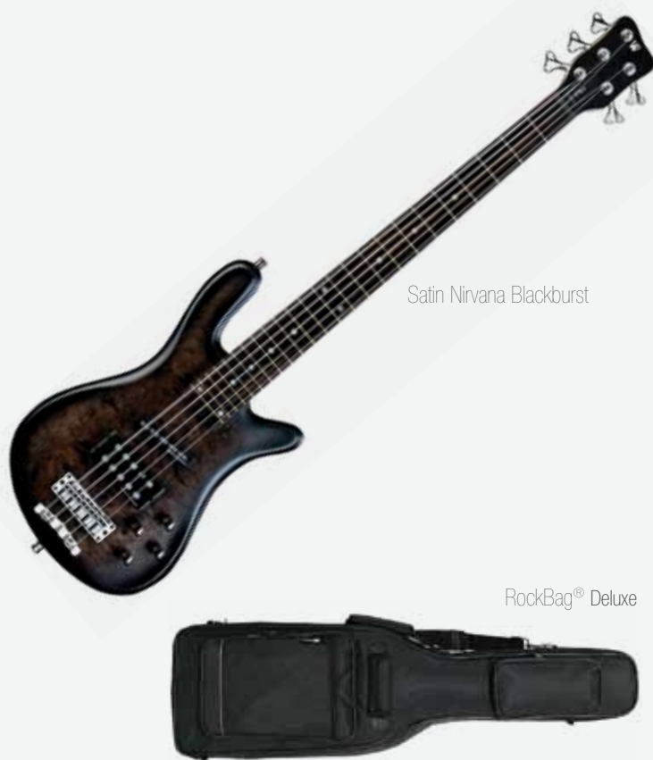
Satin Nirvana Blackburst

** Puxando o botão de Treble, permite a divisão do captador MM.