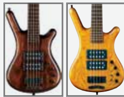
TOBAC (Antique Tobacco) HONEY (Honey Violin)