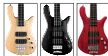
Natural Satin Nirvana Black Burgundy Red