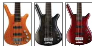
Honey Violin Nirvana Black Burgundy Red