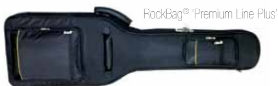
RockBag® 'Premium Line Plus'