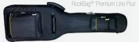
RockBag® 'Premium Line Plus'